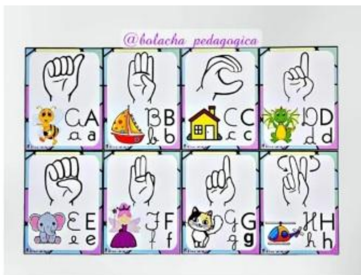
FIGURA 1 – PAINEL ALFABETO