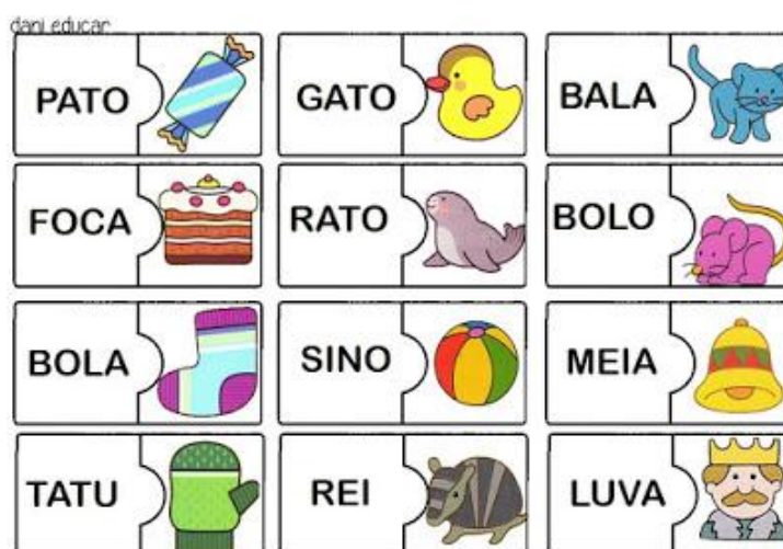
FIGURA 2 – QUEBRA CABEÇA